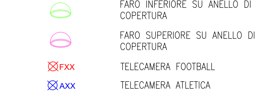
BALCONY 1 BALCONICINI DOTATI DI FARI STRUTTURA PORTAFARI SU ANELLI DI COPERTURA